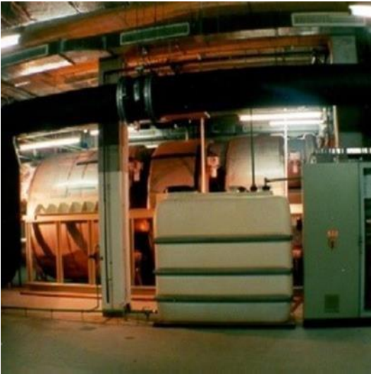
Abbildung 2: Sorptionsspeicher mit Zeolith im Fernwärmenetz der Münchner Stadtwerke

F&E, z.T. im Demonstrationsstadium. Technology Readiness Level (TRL): 5-7