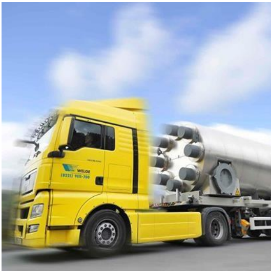
Abbildung 3: Mobiler Sorptionsspeicher zur Abwärmenutzung in Hamm /NRW

Beispiel 1 Ein mobiler Sorptionsspeicher mit Zeolith wurde zur Abwärmenutzung an einer Müllverbrennungsanlage entwickelt und eingesetzt. Die Speicherkapazität des Zeolithcontainers beträgt max. 4 MWh. Die Kosten für die bereitgestellte Wärme liegen bei ca. 40-50 EUR/MWh. Der Kostenabschätzung liegt die Annahme von 1.000 Zyklen/Jahr zugrunde.