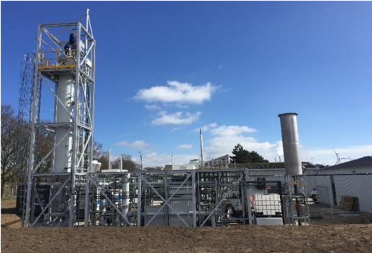
Abbildung 3: Power-to-Gas mit biologischer Methanisierung in Kopenhagen (Avadøre), Dänemark