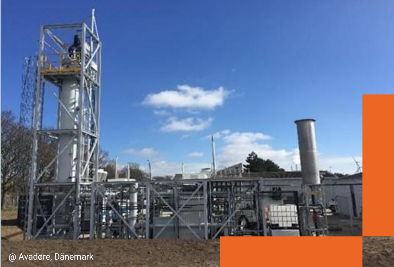
@ Avadøre, Dänemark